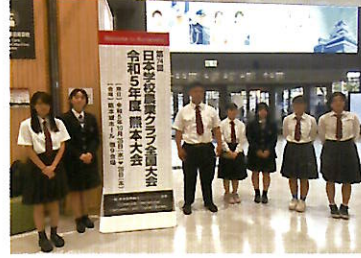
日本学校農業クラブ連盟全国大会