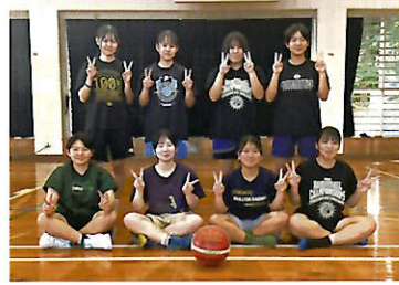
女子バスケット部