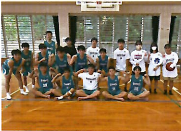
男子バスケット部