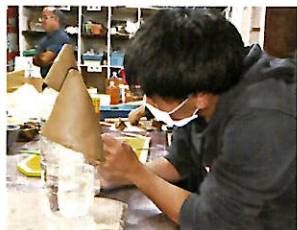
陶芸(地域資源活用)