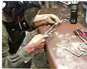
アーク溶接(農業機械)