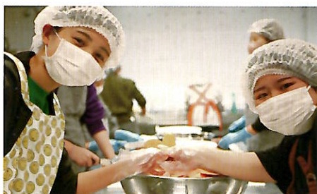
収穫物の加工実習