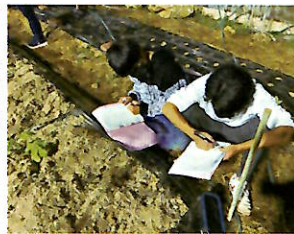
生育調査(農業と環境)