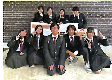
プロジェクト同好会